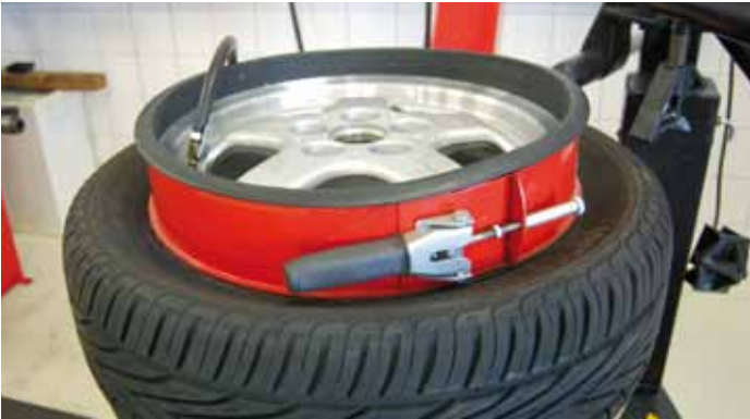
Afb. 18: tubeless ring

De tubeless ring (afbeelding 18) wordt steeds minder gebruikt, maar werkt nog altijd uitstekend. De ring sluit de hiel en de velgrand keurig af. Tijdens het op spanning komen van de band komt de ring langzaam los van het wiel. De tubeless ring is verkrijgbaar voor verschillende wieldiameters.