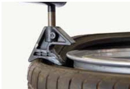
Afb. 13: hulparm of klem die de hiel in het diepbed houdt tijdens montage