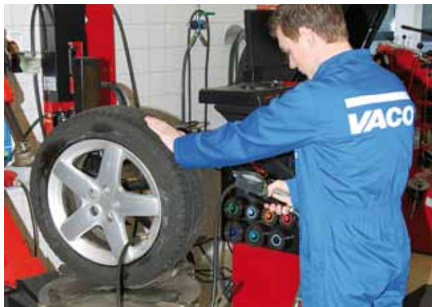
Afb. 14: sta bij het oppompen in de richting van het loopvlak

Houd vanzelfsprekend enige afstand tot de band. Als de band klapt, zal deze veel stof (onder meer roest) in de omgeving verspreiden. Zorg ervoor dat je hierbij altijd in de richting van het loopvlak blijft staan (afbeelding 14). Een band klapt altijd naar de zijkant. Als een band begint te kraken stop dan onmiddellijk met pompen en laat de band leeglopen.