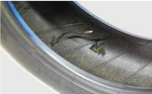
Afb. 23: band met spijker en karkasschade: altijd demonteren bij reparatie

Een band kan je alleen goed inspecteren als die gedemonteerd is (afbeelding 23). Dan kan je de band zowel aan de buiten- als binnenkant grondig onderzoeken. Gebruik hierbij een goede looplamp en een priem om eventuele beschadigingen te beoordelen. Het is aan te raden om een bandenspreider te gebruiken om vooral de binnenzijde goed te kunnen bekijken. Nadat je de lekveroorzaker hebt gevonden en alle beschadigingen hebt bekeken, kan je met een schade- of reparatietabel bepalen of je de band kan repareren of moet afkeuren.