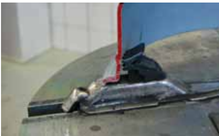
Afb. 4: opspannen van binnenuit

Opspannen kan van binnenuit (afbeelding 4) of van buitenaf gebeuren (afbeelding 5). Bij opspanning van binnenuit kan je grotere wielmaten inklemmen. Grotere wielmaten zijn echter vaak lichtmetalen wielen. Deze beschadigen bij opspanning van binnenuit snel door de kartelrand. Span dus, als mogelijk, de wielen van buitenaf op.