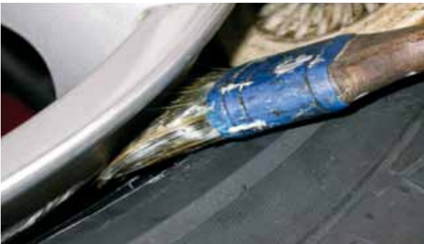
Afb. 3: insmeren hump en hoorn van de velg

De bandenpasta kan je het beste met een platte kwast aanbrengen op de hiel van de band en de hump en hoorn van de velg (afbeelding 3). Eventueel zijn er ook spuitbussen verkrijgbaar waarmee de pasta nog beter tussen band en velg in komt.