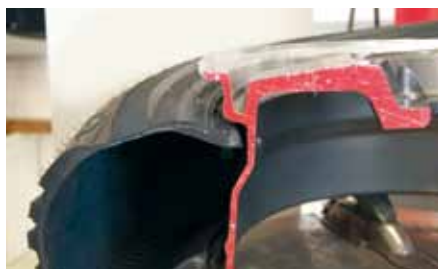
Afb. 9: hiel in diepbed

Bij zowel de demontage als de montage is het belangrijk dat de hiel van de band goed in het diepbed van de velg ligt (afbeelding 9). Is dit niet het geval, dan beschadigt de hiel heel snel doordat deze sterk verbuigt (afbeelding 10).