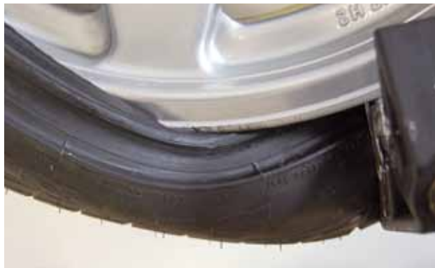
Afb. 11: grote spanning op de hiel

Verder zijn er hulparmen die de hiel van het schuine velgbed loshalen nadat de eerste hiel is gedemonteerd (afbeelding 11). De tweede hiel zit immers vaak klem op het velgbed.