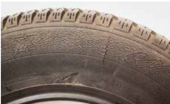
Afb. 26: droogtescheuren