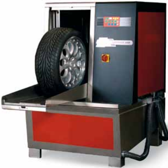
Afb. 22: wielenwasmachine

Werken met vuile banden en wielen is nooit prettig. Vandaar dat bandenservice-bedrijven in toenemende mate gebruikmaken van wielenwasmachines (afbeelding 22) die de hele band-wielcombinatie grondig reinigen. Dit is niet alleen prettiger voor de monteur en de klant, maar het vereenvoudigt ook het werken met de band-wielcombinatie doordat alles goed zichtbaar is. Daarnaast heb je als medewerker geen last van (rem)stof en blijft de werkplaats schoner.