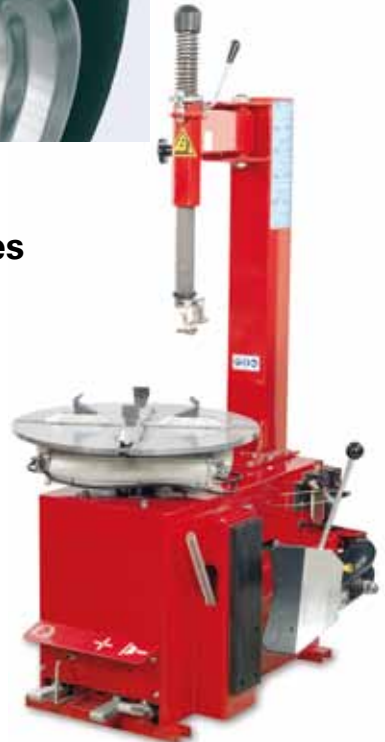
Afb. 2: conventioneel montageapparaat

Laat de lucht uit de band lopen door het binnenventiel te verwijderen. Zorg ervoor dat je de vrijkomende stof (onder andere remstof) zo min mogelijk inademt.