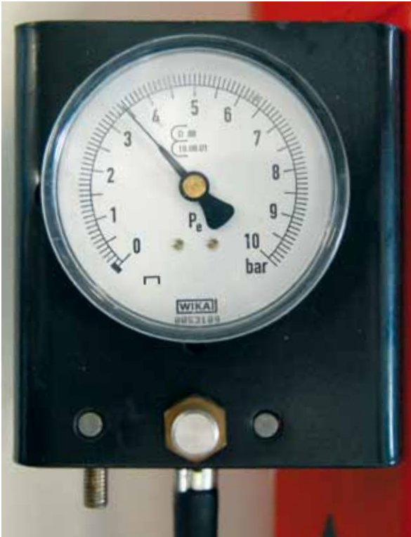
Afb. 17: maximale druk bij het zetten van de hiel

Een bandenspanningscomputer kan je werk versnellen doordat de je niet bij de band hoeft te wachten totdat hij de correcte bandenspanning heeft. Ook is het veiliger omdat je niet bij de band in de buurt hoeft te staan tijdens het oppompen. Een nadeel is echter dat je niet kan letten op het zetten van de hiel over de veiligheidsribben en het centreren.