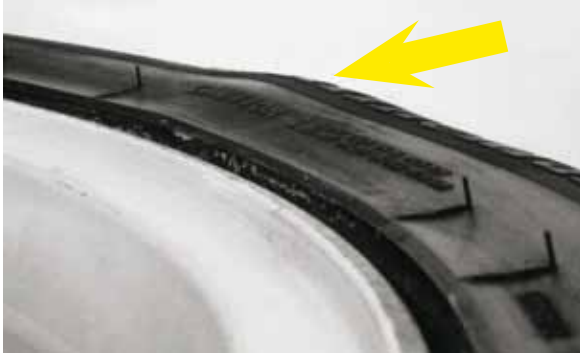
Afb. 25: doorgesneden radiaaldraden