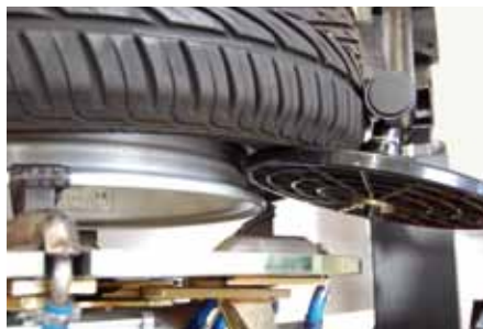
Afb. 12: hulparm om de onderste hiel los te maken

Voor hulp bij de montage zijn er armen die de hiel in het velgbed houden en voorkomen dat de hiel langs de hoorn glijdt (afbeelding 12 en afbeelding 13). Alleen als de hiel in het velgbed ligt, past de hiel over de velgrand heen. Hiervoor zijn ook losse hielklemmen verkrijgbaar die je op de velgrand kan monteren.