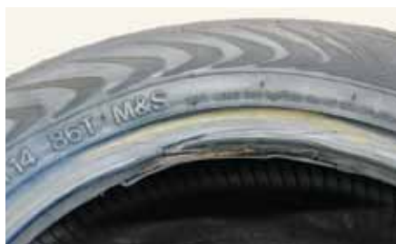
Afb. 10: beschadigde hiel