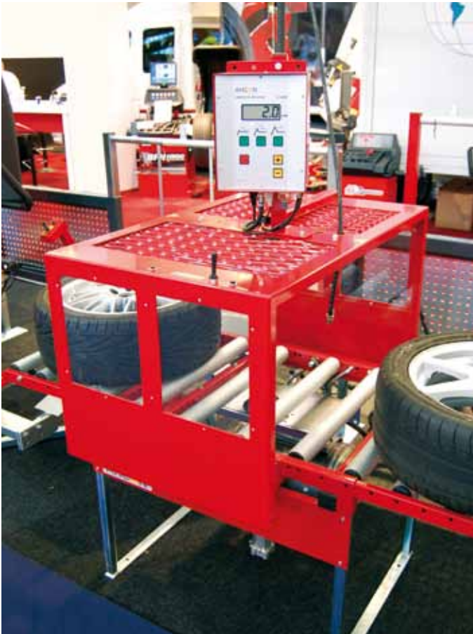
Afb. 16: montagestraat met pompklok en kooiconstructie

Pomp personenwagenbanden niet hoger op dan 3,5 bar en bestelwagenbanden dan 4,5 bar. Als de hiel van de band zich niet goed zet op de randen van het wiel moet je de band laten leeglopen en de hiel van de band losdrukken. Smeer de hiel van de band voldoende in met montagepasta en start de montageprocedure opnieuw.