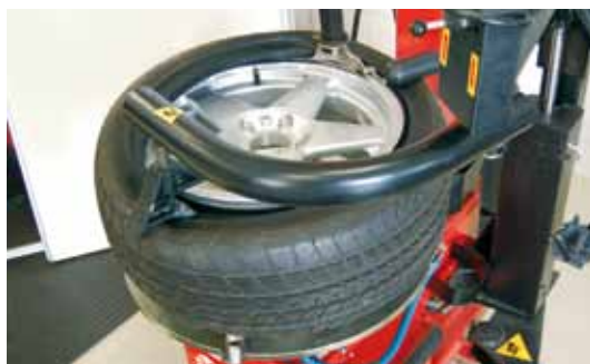
Afb. 8: hulparmen bij montageapparaat

Het monteren van banden met een lage sectiehoogte is zeker niet eenvoudig. Stugge gordels en karkaslagen, lage sectiehoogten en brede banden maken de banden moeilijk hanteerbaar. Tegenwoordig zijn er toch allerlei hulpmiddelen verkrijgbaar die een beheerste en gecontroleerde montage vereenvoudigen en daarmee beschadiging van de band en het wiel voorkomen (afbeelding 8).