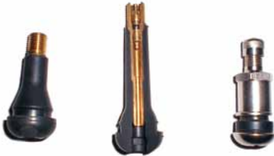
Afb. 21: v.l.n.r. een volrubber ventiel, een opengewerkt ventiel met metalen kern en een metalen ventiel

Ventielen (afbeelding 21) zijn van rubber en rubber veroudert. Bij vernieuwing van een band moet je ventielen daarom altijd vervangen. Na het verwijderen van de band kan je het oude ventiel met een zijknijptang of een mes afsnijden. De keuze van het nieuwe ventiel hangt af van de vorm van het wiel en de bandenspanning. Afhankelijke van de positie van het ventielgat in het wiel kan je voor een korter of een langer ventiel kiezen. Er bestaan ook ventielverlengers, maar helaas veroorzaken deze regelmatig lekkage. Ten tweede moet je kijken naar de gebruiksspanning van de band. Als de gebruiksspanning boven de 4,5 bar ligt (bijvoorbeeld bij bestelauto's) dan moet je een speciaal ventiel monteren (volgens ETRTO: V3-23-1 of V3-23-2).