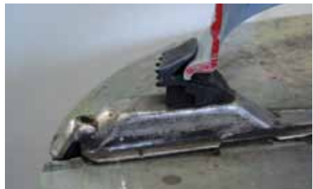
Afb. 5: opspannen van buitenaf

Een normale opspantafel heeft een bereik van 10 tot 20 inch van buitenaf en 12 tot 22 inch van binnenuit. Als je met andere wielmaten werkt, zijn hiervoor meestal speciale opzetstukken verkrijgbaar. Met een dergelijke opspanplaat kan je de kleinste kruiwagenwielletjes tot de grotere motorfietswielen opspannen (afbeelding 6).