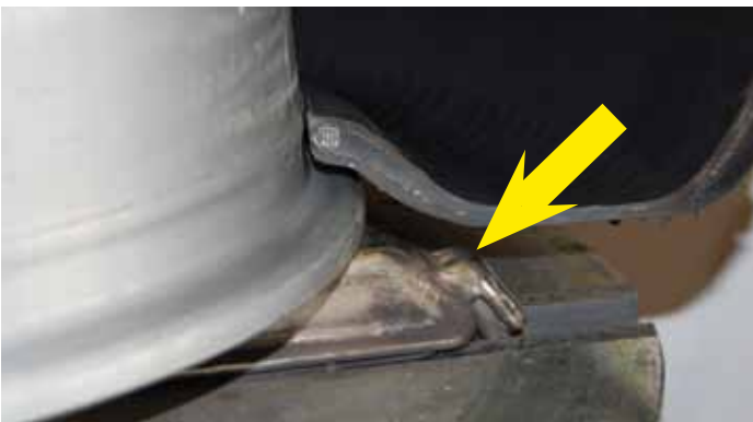
Afb. 19: vulopening op montageklauw

Als laatste zijn er speciale luchtopeningen die op de klauwen van het montageapparaat zijn aangebracht (afbeelding 19). Deze blazen ook een grote hoeveelheid lucht in één keer in de band. Hierbij is het handig om de band eerst licht omhoog te tillen. Dan gaat de lucht gemakkelijker naar binnen. Houd rekening met stof, dat via de binnenkant van het wiel vrijkomt. Adem deze zo min mogelijk in.