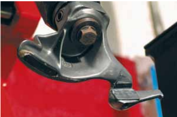
Afb. 7: montagekop met kunststof bescherming

Het is belangrijk dat je al het oude balanceergewicht verwijdert voordat je gaat demonteren. Het balanceergewicht komt anders tegen de montagekop aan. En dan zouden de velgrand en de montagekop beschadigen. De montagekop moet goed passen bij de wioldiameter en de velgrand. Bij een zeer kleine of zeer grote wioldiameter is de radius van de montagekop niet passend, waardoor montage moeilijk wordt. Tegenwoordig zijn voor de meeste machines verschillende montagekoppen leverbaar met een verschillende diameter, een andere vorm en soms ook van ander materiaal dan staal gemaakt. Vooral voor lichtmetalen wielen worden minder vaak stalen montagekoppen toegepast om beschadiging van de wielen te voorkomen (afbeelding 7).