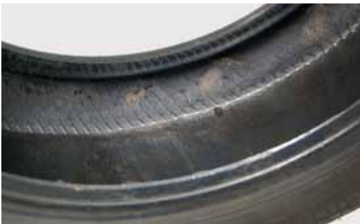
Afb. 24: marmering