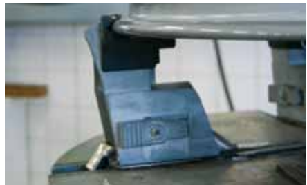
Afb. 6: opspannen van grote wielen en motorfietswielen

Een normale opspantafel heeft een bereik van 10 tot 20 inch van buitenaf en 12 tot 22 inch van binnenuit. Als je met andere wielmaten werkt, zijn hiervoor meestal speciale opzetstukken verkrijgbaar. Met een dergelijke opspanplaat kan je de kleinste kruiwagenwielletjes tot de grotere motorfietswielen opspannen (afbeelding 6).