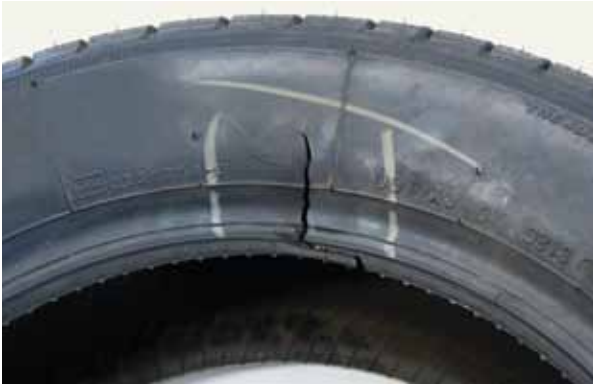
Afb. 15: hielkern gebroken door te hoge spanning tijdens montage

Na het monteren van de band op het wiel moet je de band op spanning brengen. Normaal gesproken kan je zonder problemen een bandenspanningsmeter gebruiken. Eerst moet de hiel over de veiligheidsribben (hump) heen. De spanning waarbij dit gebeurt, verschilt sterk en de knal die daarmee gepaard gaat ook. Als een band bij 2,5 bar nog niet over de veiligheidsribben heen is, moet je hem weer laten leeglopen en de veiligheidsribben extra goed insmeren met montagepasta of er montagevloeistof op spuiten. Als de band bij een te hoge spanning over de ribben heengaat, kan de hiel recht afbreken (afbeelding 15).